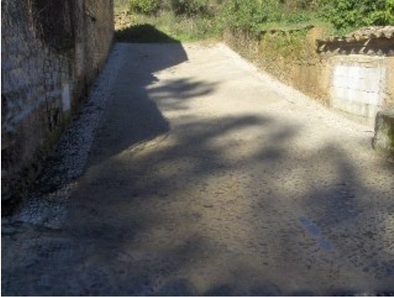
( http://www.valdelarco.es/export/sites/valdelarco/es/.galleries/imagenes-noticias/2013/Abril/mejora-infraestructuras/calle-bomba1.jpg )