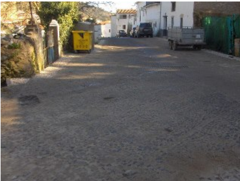
( http://www.valdelarco.es/export/sites/valdelarco/es/.galleries/imagenes-noticias/2013/Abril/mejora-infraestructuras/calle-bomba.jpg )